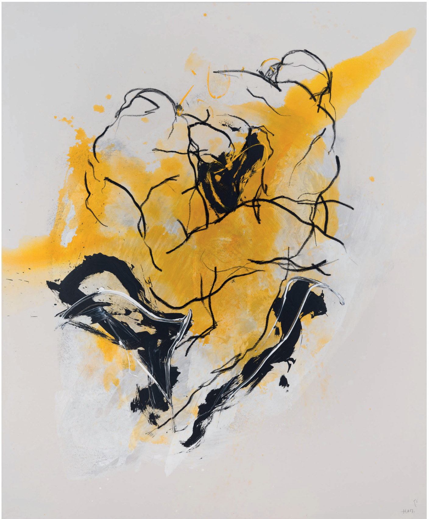
„Expressivität der Darstellung“ 2025 (Sammlung Werner Trenker) Öl, Acryl auf Leinwand | 230 x 190 cm