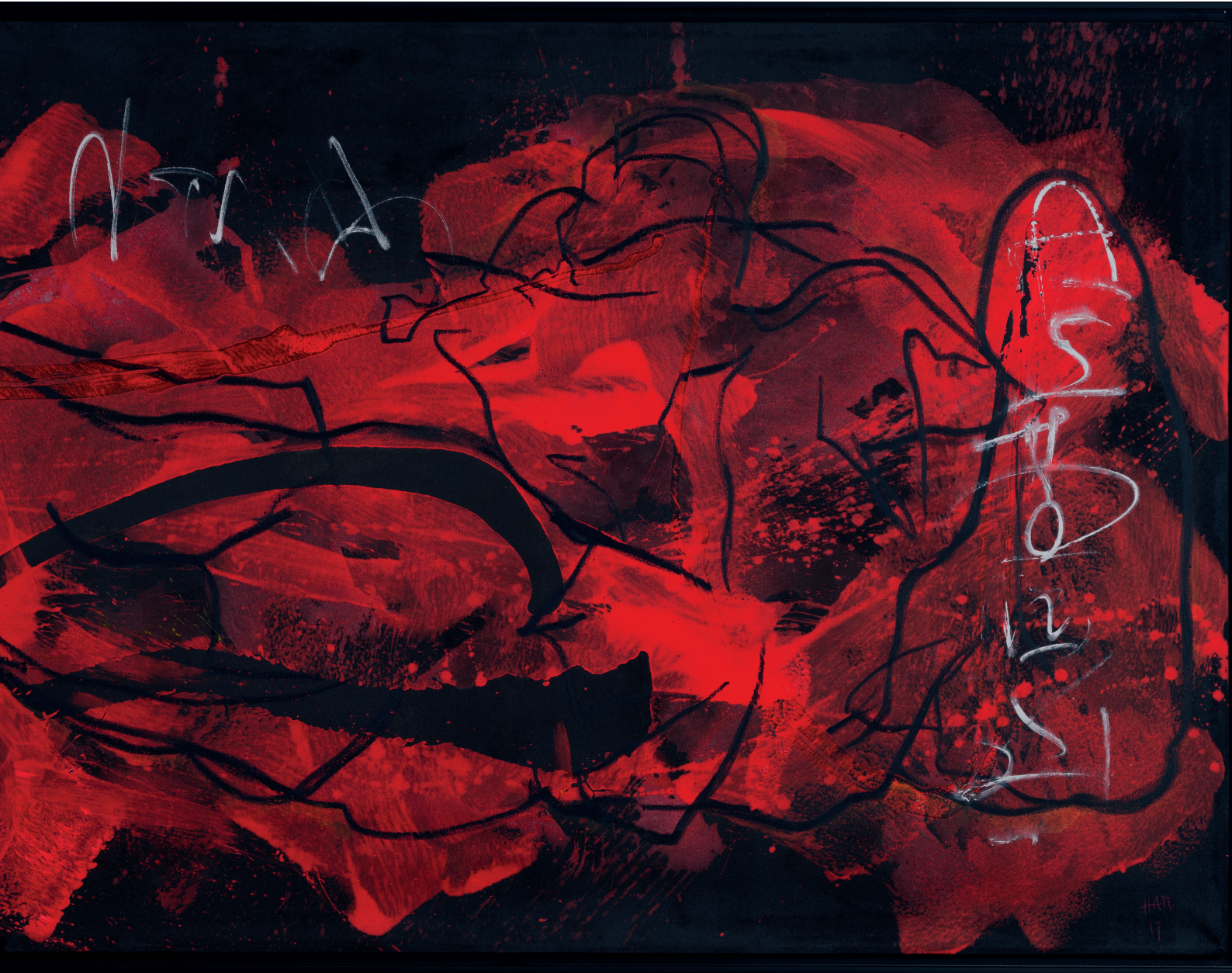
La première Mysterium Serie Le Sacre 2015/2019 (Sammlung Werner Trenker) Öl, Acryl, Sand auf Leinwand | 150 x 390 cm