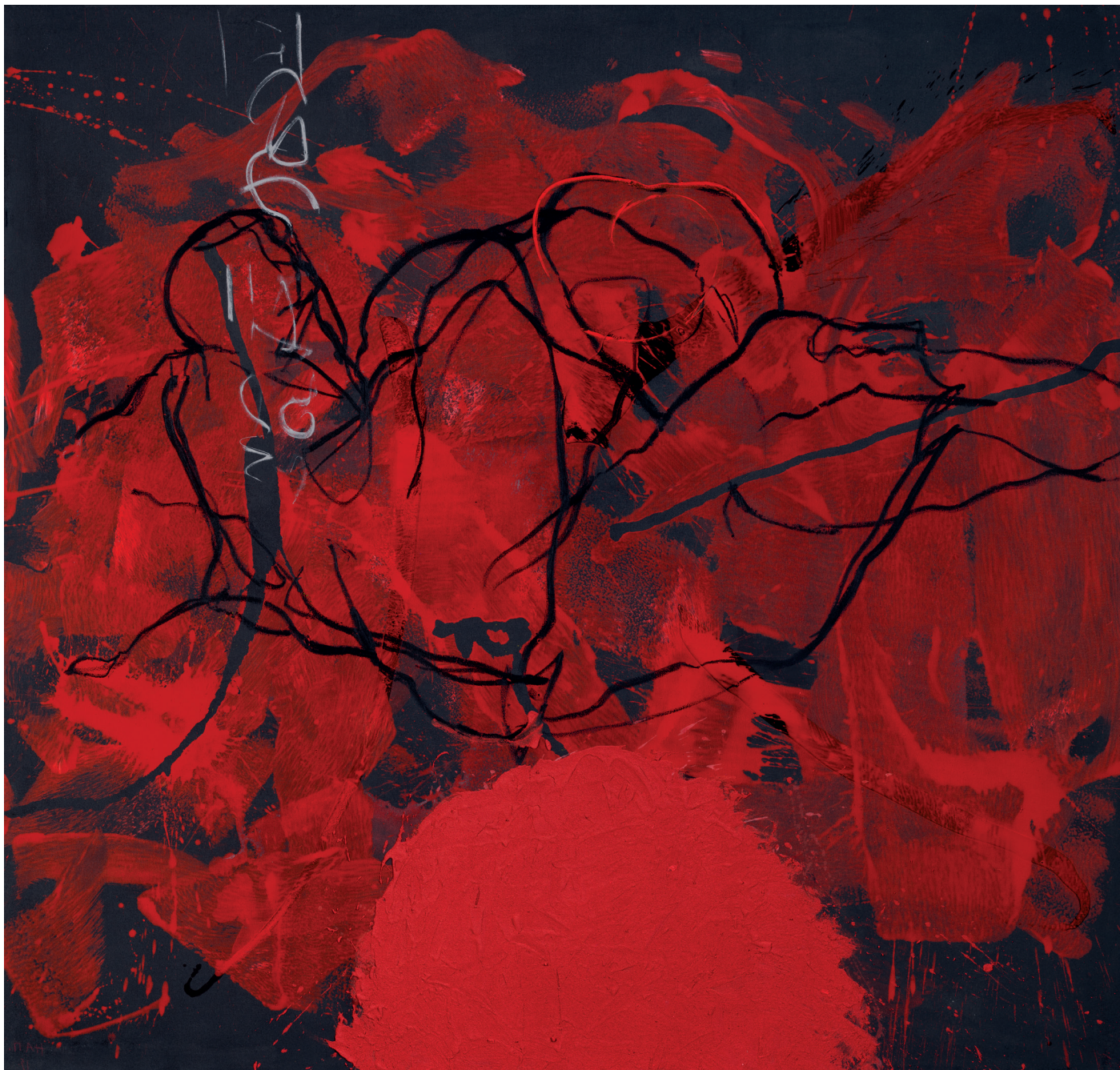
„Impact“ 2015 (Sammlung Werner Trenker) Öl, Acryl auf Leinwand | 210 x 220 cm