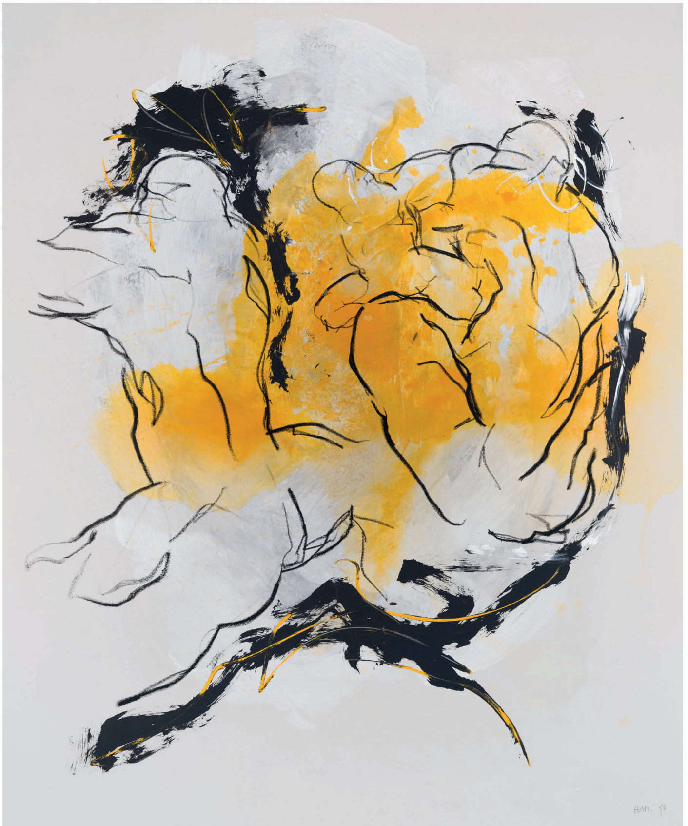
„Enttäuschte Erwartung“ 2025 (Sammlung Werner Trenker) Öl, Acryl auf Leinwand | 230 x 190 cm