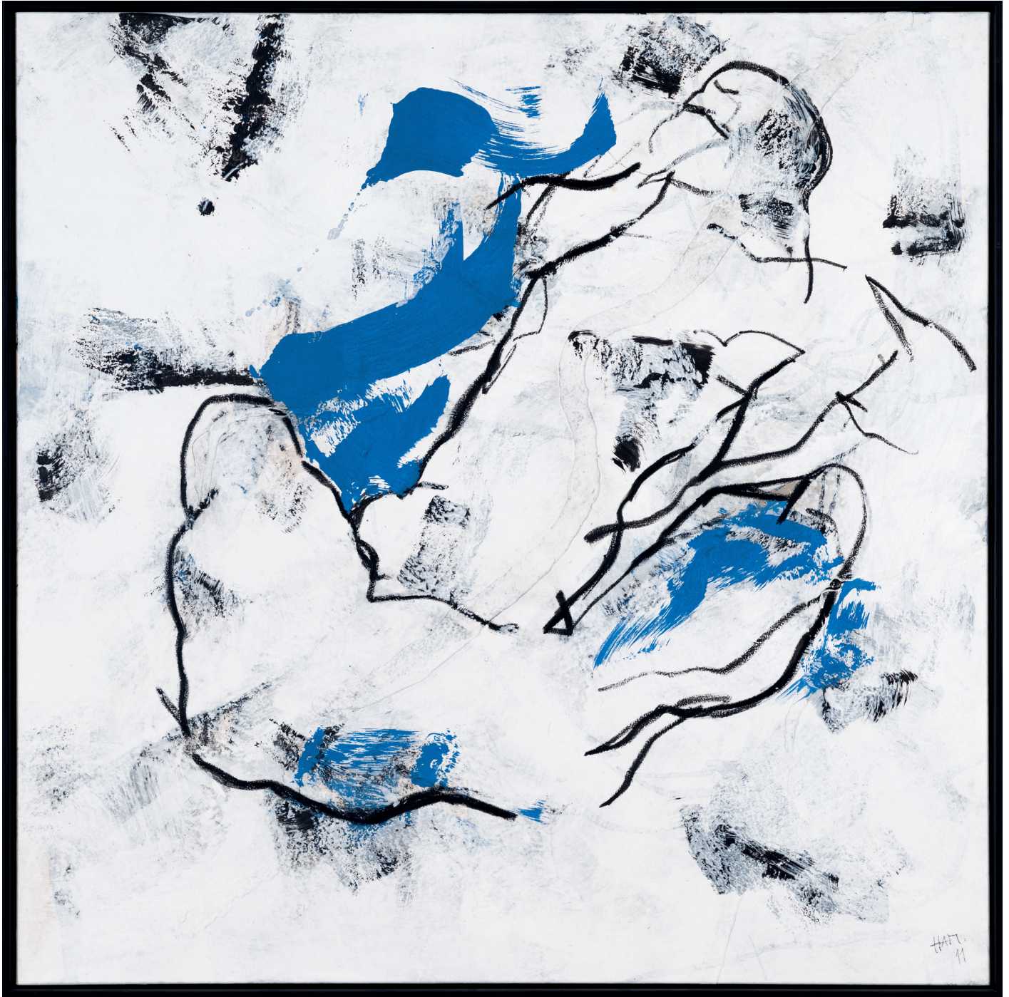
„Topographie des Körpers“ 2011 (Sammlung Werner Trenker) Öl, Acryl auf Leinwand | 160 x 160 cm