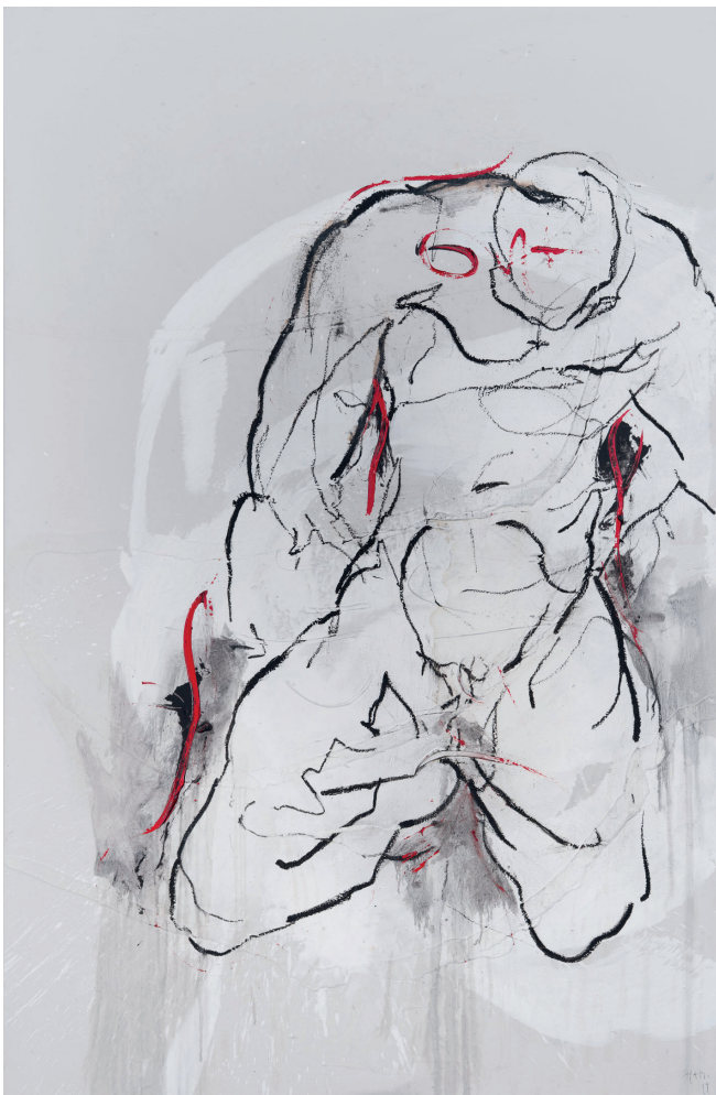
„Aufrichtung koloriert“ 2019/2026 (Sammlung Werner Trenker) Öl, Acryl auf Leinwand | 200 x 130 cm

„ Wenn wir nicht fähig sind, Beziehungen human und ethisch zu führen, wie sollen wir dann die Welt verstehen? “ – Hannes Mlenek