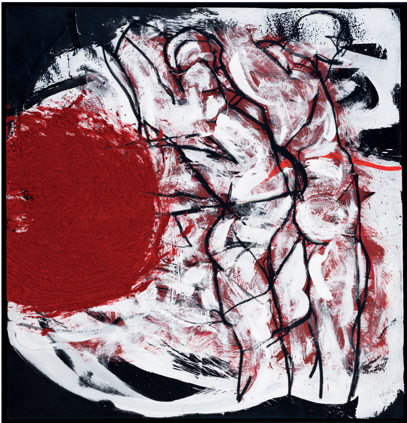
„Le sacre“ 2013 (Sammlung Werner Trenker) Öl, Acryl und Sand auf Leinwand | 200 x 190 cm