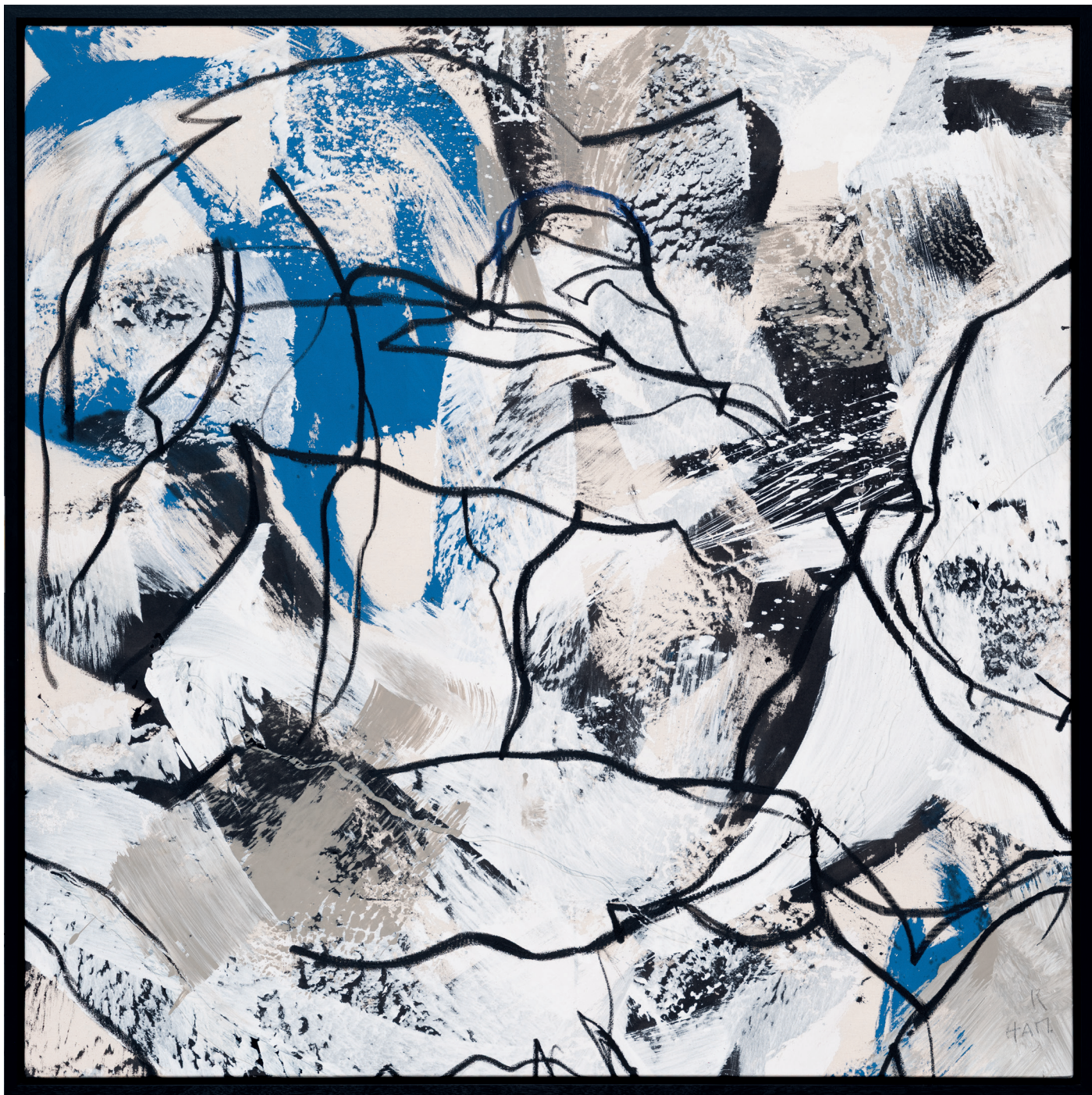
„Die Archäologie des Körpers“ 2012 (Sammlung Werner Trenker) Öl, Acryl auf Leinwand | 160 x 160 cm